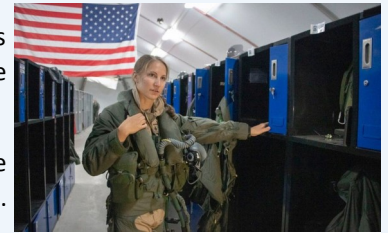
Capitaine Emily Thompson — US AIR FORCE

Début juin, la capitaine Emily Thompson, de l'armée de l'air américaine, a été la première femme à piloter un chasseur furtif au combat : un F-35A, fleuron de l'aviation américaine. De plus, l'équipe de maintenance qui a permis son vol était exclusivement féminine.