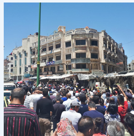
Image rendue publique sur le site Suwayda 24 illustrant les manifestations anti-Assad.

Lundi 8 juin, les terroristes du Front Al-Nosra, soutenus par la Turquie, ont tenté de s'emparer de la localité de Tanjura, en Syrie. Après avoir réussi à percer les lignes syriennes sur 600 mètres, ils ont subi une contre-attaque de l'armée russe. Plus de 30 terroristes ont été mis hors de combat, selon la Russie.