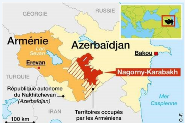
Carte publiée sur Ouest-France

Le vendredi 9 octobre, la Russie a invité à Moscou les ministres de la défense arméniens et azerbaïdjanais pour essayer de régler le conflit dans le Haut Karabakh.